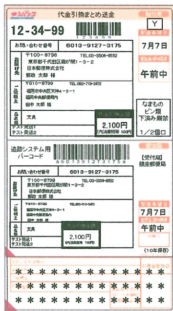
【現在のラベルで印字した場合】